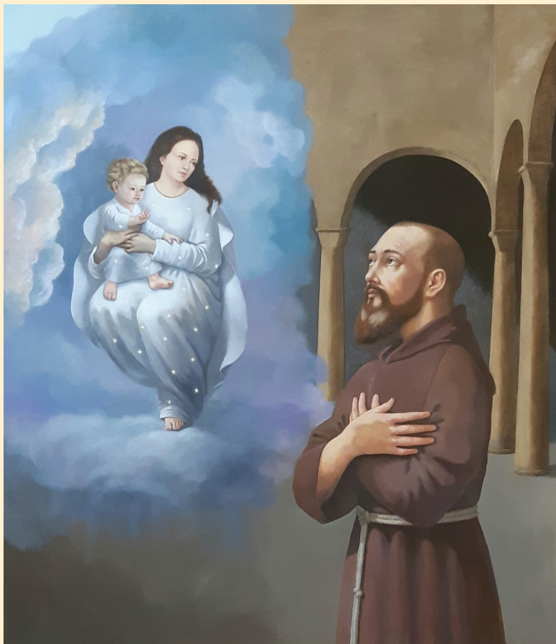
Fig. 1: Valeria D'Ascenzi, Viziunea Sfintei Fecioare Maria (2023), Sanctuarul Fericitul Ieremia Valahul – Onești (230 x 200 cm)

Cripta sanctuarului Fericitul Ieremia din Onești găzduiește de puțin timp două picturi însemnate, opera pictorilor italieni Valeria D'Ascenzi și Ivo Batocco, ce ilustrează un moment memorabil din viața fratelui Ieremia: viziunea Sfintei Fecioare Maria. Conform mărturiilor din procesul de canonizare 1 , după o noapte petrecută în rugăciune, cel mai probabil în ajunul solemnității