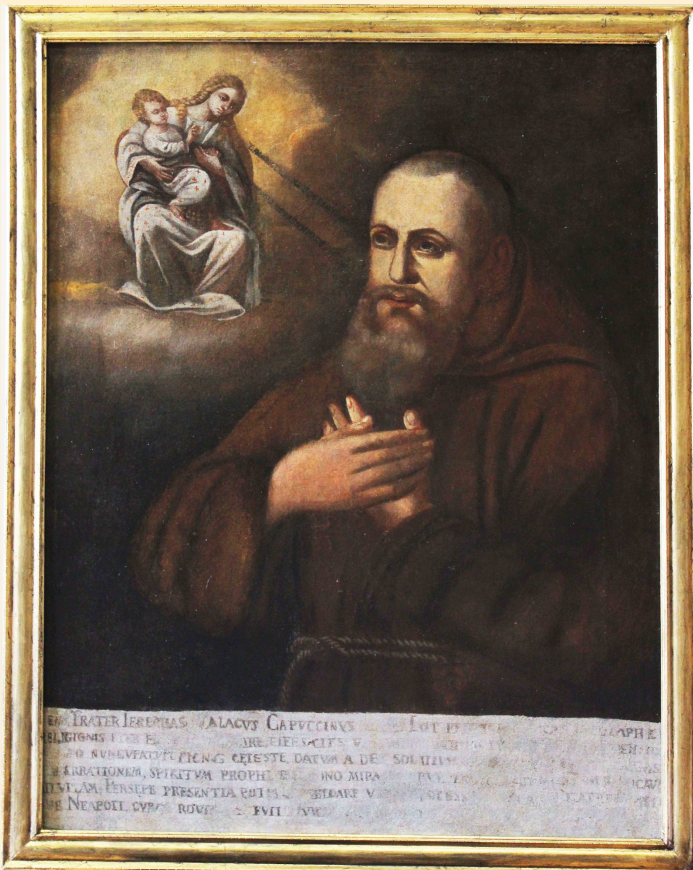
Fig. 3: Anonim italian, Fericitul Ieremia Valahul (sec. XVII), Muzeul Franciscan, Roma (97 x 73 cm)

o aureolă deasupra capului lui Ieremia amintesc de arhitectura săracă și umilă a fraților capucini, conformă primelor constituții ale Ordinului 2 , și de contextul în care fratele român a răspuns chemării divine, pășind