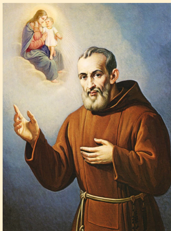
Fig. 2: Alfino Missori, Fericitul Ieremia Valahul (1977), biserica capucinelor din Napoli (Piedigrotta)

Adormirii Macii Domnului din anul 1608, aprins de dorința de a putea contempla frumusețea Fecioarei Maria în slava cerească, imploră stăruitor acest dar la Dumnezeu și la Maica Sa Preasfântă. Și minunea nu s-a lăsat mult așteptată: la ivirea zorilor, i-a apărut Sfânta Fecioară Maria învăluită într-o lumină strălucitoare, ținând în brațele sale pe Fiul său. Veșmintele lor erau mai albe decât zăpada și acoperite de stele. În fața acestei măreții cerești, Ieremia căzu cu fața la pământ plin de uimire. Regina Cerului i s-a adresat spunându-i: Privește! Nu pot, a răspuns Ieremia, simt cum îmi dau sufletul, simt că leșin. Ridică-te, i-a spus Fecioara, îți dau puterea să mă poți privi . Și ridicându-și privirea, Ieremia a văzut cum fiecare stea care împodobește veșmintele lor, deși strălucea mai tare decât soarele, putea fi admirată fără a dăuna ochilor. Adresându-i-se din nou