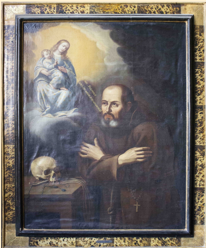
Fig. 4: Anonim italian, Fericitul Ieremia Valahul (sec. XVII), Pontificio Collegio Greco, Roma (134 x 98 cm)

În partea stângă este reprezentată Sfânta Fecioară Maria, luând în considerație trăsăturile menționate în procesul de canonizare: cu veșmintele albe, acoperite de stele strălucitoare, ținând în brațe în partea dreaptă pe pruncul Isus îmbrăcat în același fel, cu părul desfăcut și fără a purta o coroană. Sunt trăsături care evocă unele titluri cu care Ieremia i se adresa în rugăciune: Maica lui Dumnezeu, Fericita Fecioară Maria, Regina Cerului, Înstelata mea (mia Stellata) . Veșmântul mai alb decât zăpada simbolizează fecioria ei. Este culoarea aleasă de pictori pentru a reprezenta și Neprihănită sa Zămislire. Pruncul din brațele sale întruchipează maternitatea sa divină. Veșmintele împodobite de stele, asemănătoare cu cele ale Fiului său, exprimă slava cerească de care se bucură Maria, cea plină de har. Privirea caldă plină de gingășie amintește de apelativul Măicuța